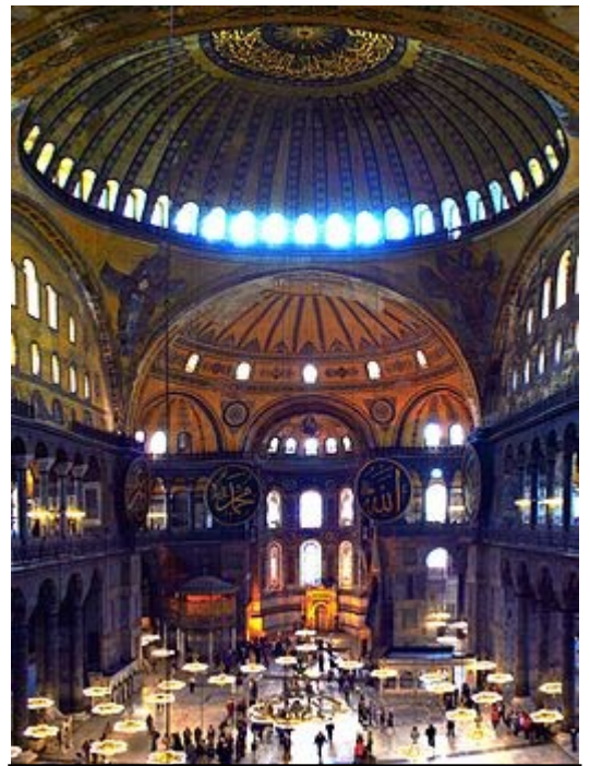
La coupole culmine à 55 mètres du sol.