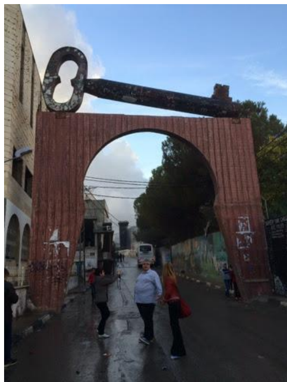
Entrée du camp d’Aida à Bethléem.