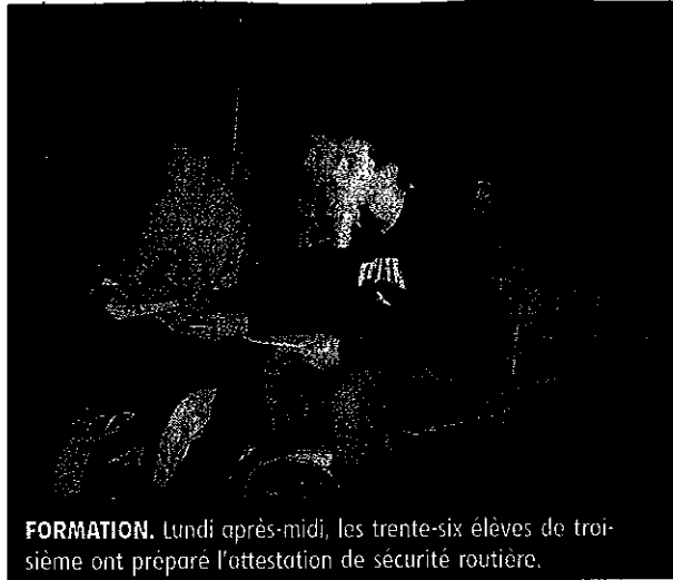
FORMATION. Lundi après-midi, les trente-six élèves de troisième ont préparé l'attestation de sécurité routière.