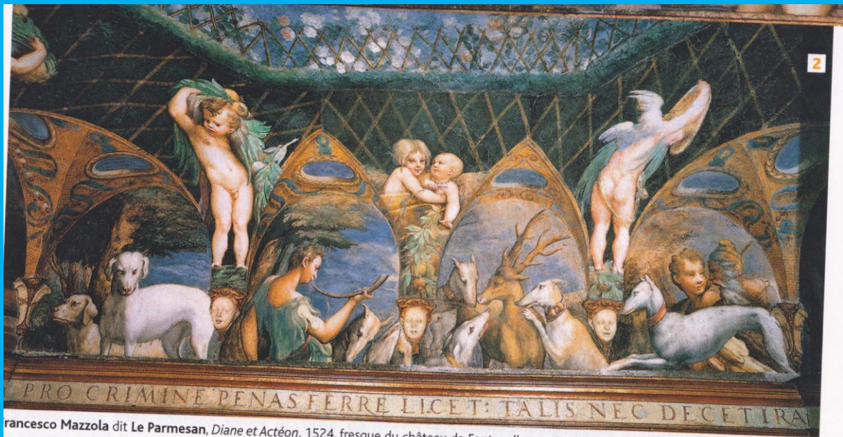
Francesco Mazzola dit Le Parmesan, Diane et Actéon , 1524, fresque du château de Fontanellato, près de Parme (Italie).