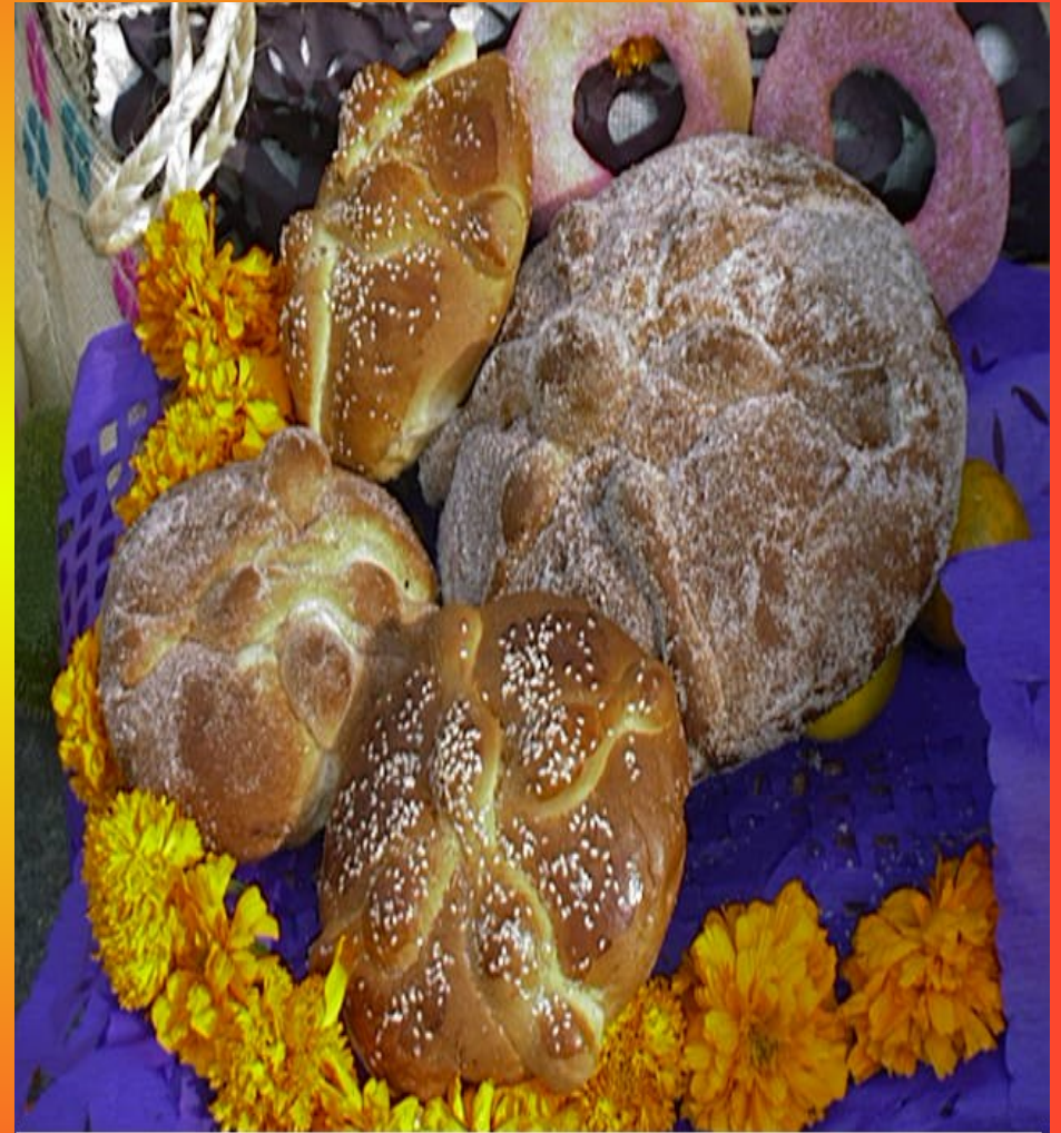
Los panes de muerto caracterizan a cada región del país y toman diferentes formas.