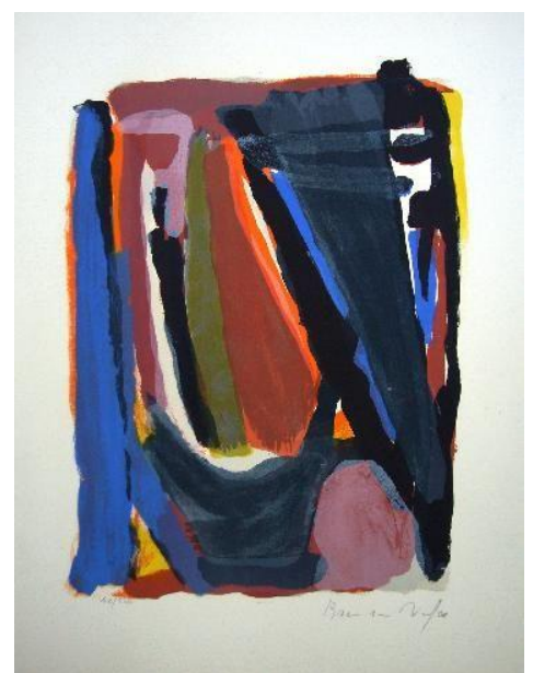
Sans titre, 1973. Lithographie 6 couleurs. 41 X 30 cm.

Visites guidées gratuites les 28-07 et 25-08 à 15h.