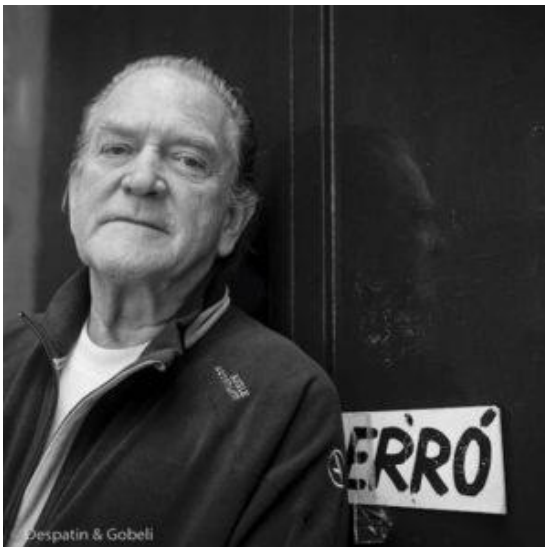
Gudmundur Gudmundsson dit Erro.

Erro est un artiste de la figuration narrative.